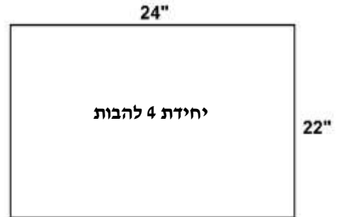
מידות האזור המכורסם